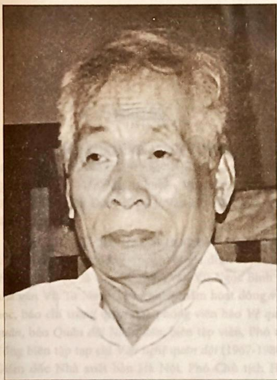
Nhà thơ VŨ CAO

TÁC PHẨM CHỮ ĐÓNG (SỐ BÀN): Sơn thủy (thơ, 1962); Đâu Trúc (thơ, 1970); Truyện một người bị bắt (tập truyện ngắn, 1958); Những người cùng lòng (tập truyện ngắn, 1959); Đeo kính bên bờ sông Lạc (truyện thiếu nhi, 1967); Tuổi em anh chúng